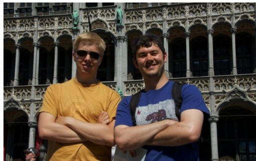
Jag (till vänster) och en kompis på rundresa i Europa under det två månader långa vårlovet