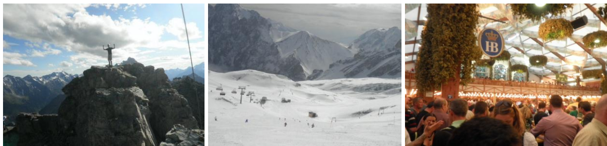
Vandring respektive skidåkning i Alperna. Bilden längst till höger från ett av "tälten" på Oktoberfest

Technische Universität München (TUM) är ett stort och välrenommerat tekniskt universitet, som dessutom har ett utmärkt läge i Europa. Staden har 1,3 miljoner invånare (2,5 i stor-München) vilket gör att det alltid finns något på gång. Det är inte heller långt till bland annat Österrike, Schweiz, Italien och Tjeckien och det är lätt att resa med tåg. Naturen i södra Bayern är också riktigt fin, med Alperna bara en dryg timme bort. Det var många lediga dagar som kom att ägnas åt vandring och skidåkning. Ett måste om man bor i München! Ett mycket bra erbjudande som Deutsche Bahn har är Bayernticket för upp till fem personer och en dag i alla regionaltåg. För 29 euro kan alltså fem personer besöka en stad eller åka till bergen över dagen. På vintern finns det även erbjudanden som kombinerar tåg med skidåkning på exempelvis Zugspitzglaciären (Tysklands högsta berg).