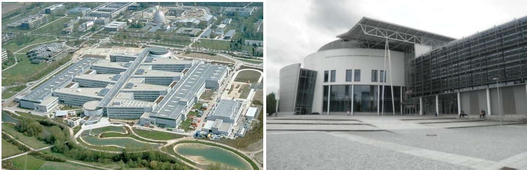
Fakulteten för maskinteknik, ca 15 km utanför centrala München, där de flesta ES-relevanta kurserna ges

Kurserna på TUM är i form av föreläsningar, ibland med övningar, och "Praktikum", vilket är mer praktiskt arbete (laborationer, grupparbeten etc). Man behöver inte vara tidigt ute för att söka föreläsningar och övningar. Välj för många från början, gå på första tillfället och se om kursen passar eller inte. Jag hade inga Praktikum-kurser, vilket bland annat hade att göra med att platserna tog slut på några minuter och att arbetsbelastningen ofta är hög och jag ville hinna med mer än att bara sitta böjd över studier. Men de kan nog vara de mest givande kurserna.