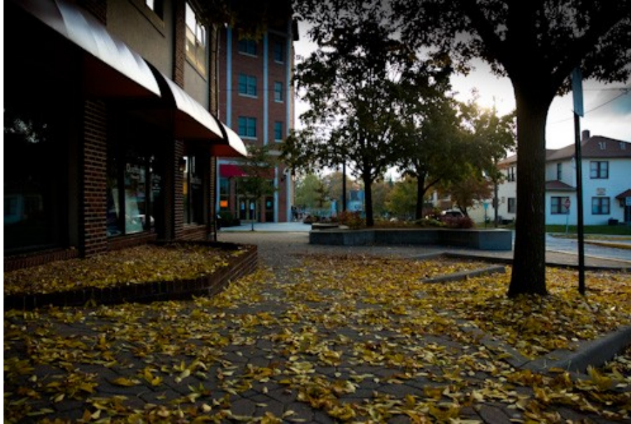
West Lafayette består av några stora vägar och massa mindre trevliga gator, såsom denna.

Nu över till vad man skall göra när man inte pluggar. Dels finns aktivitetsklubbar som främst anordnas av studenter vid universitetet. Dels finns en ny stad och framförallt nya människor att träffa. Först om klubbarna: dessa är i stort sett oändliga och i stort sett alla är med i någon eller flera klubbar. Exempel på aktiviteter hos klubbarna är: roddträning/tävling, schack, föreläsningar om energi, filosofi, basket, fotboll, tennis o.s.v. Allt finns. Dessa klubbar anordnas mer eller mindre regelbundet beroende på ambition och mål hos de som har hand om den. Utöver detta finns en enorm träningsanläggning med allt man kan tänka sig. Denna är gratis för studenter. När man inte tränar kan man förstås gå ut till någon av de lokala barerna tillsammans med sina vänner. Vänner träffar man överallt, utöver kursarna och klubbkompisarna umgås man (antagligen) mycket med andra utbytesstudenter. I West Lafayette finns fem barer och ytterligare ett tiotal finns i Lafayette. Matmässigt kryllar det av olika restauranger, både nyttiga och onyttiga.