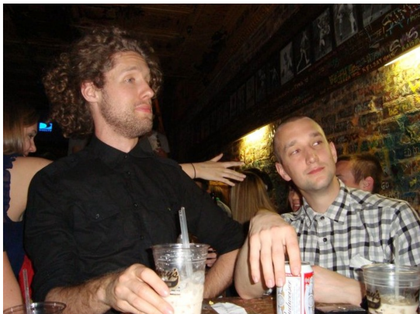
Inte alltför ovanligt med en trevlig kväll på en bar. Här syns jag (till höger) och en vän inbegripna i ett vad som verkar vara ett givande samtal.

Nu över till vad man skall göra när man inte pluggar. Dels finns aktivitetsklubbar som främst anordnas av studenter vid universitetet. Dels finns en ny stad och framförallt nya människor att träffa. Först om klubbarna: dessa är i stort sett oändliga och i stort sett alla är med i någon eller flera klubbar. Exempel på aktiviteter hos klubbarna är: roddträning/tävling, schack, föreläsningar om energi, filosofi, basket, fotboll, tennis o.s.v. Allt finns. Dessa klubbar anordnas mer eller mindre regelbundet beroende på ambition och mål hos de som har hand om den. Utöver detta finns en enorm träningsanläggning med allt man kan tänka sig. Denna är gratis för studenter. När man inte tränar kan man förstås gå ut till någon av de lokala barerna tillsammans med sina vänner. Vänner träffar man överallt, utöver kursarna och klubbkompisarna umgås man (antagligen) mycket med andra utbytesstudenter. I West Lafayette finns fem barer och ytterligare ett tiotal finns i Lafayette. Matmässigt kryllar det av olika restauranger, både nyttiga och onyttiga.