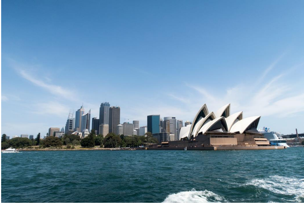
Välkända Operahuset i Sydney.