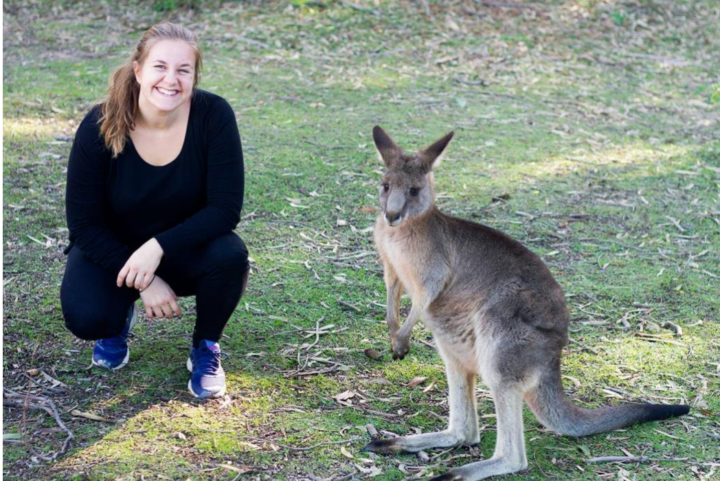
Jag och en känguru i Morisett Park.