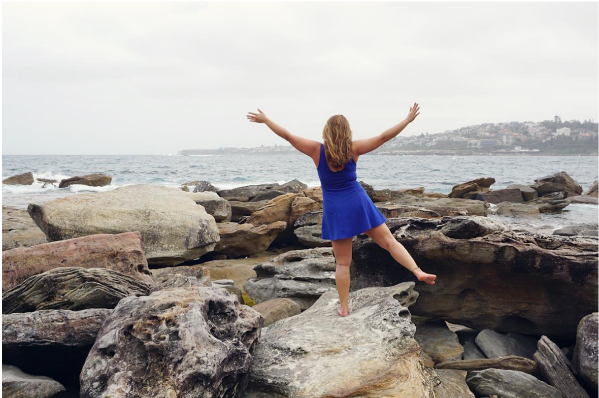
Bild från en av alla fina Coastal Walks längs Sydneys kust.