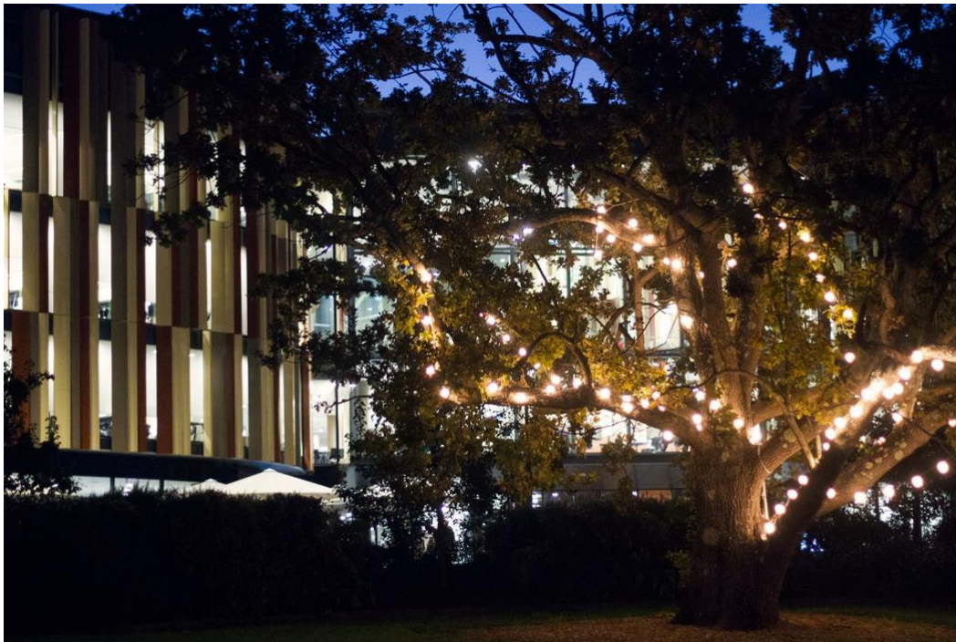
Mysigt på universitetsområdet. Macquarie University Library i bakgrunden.