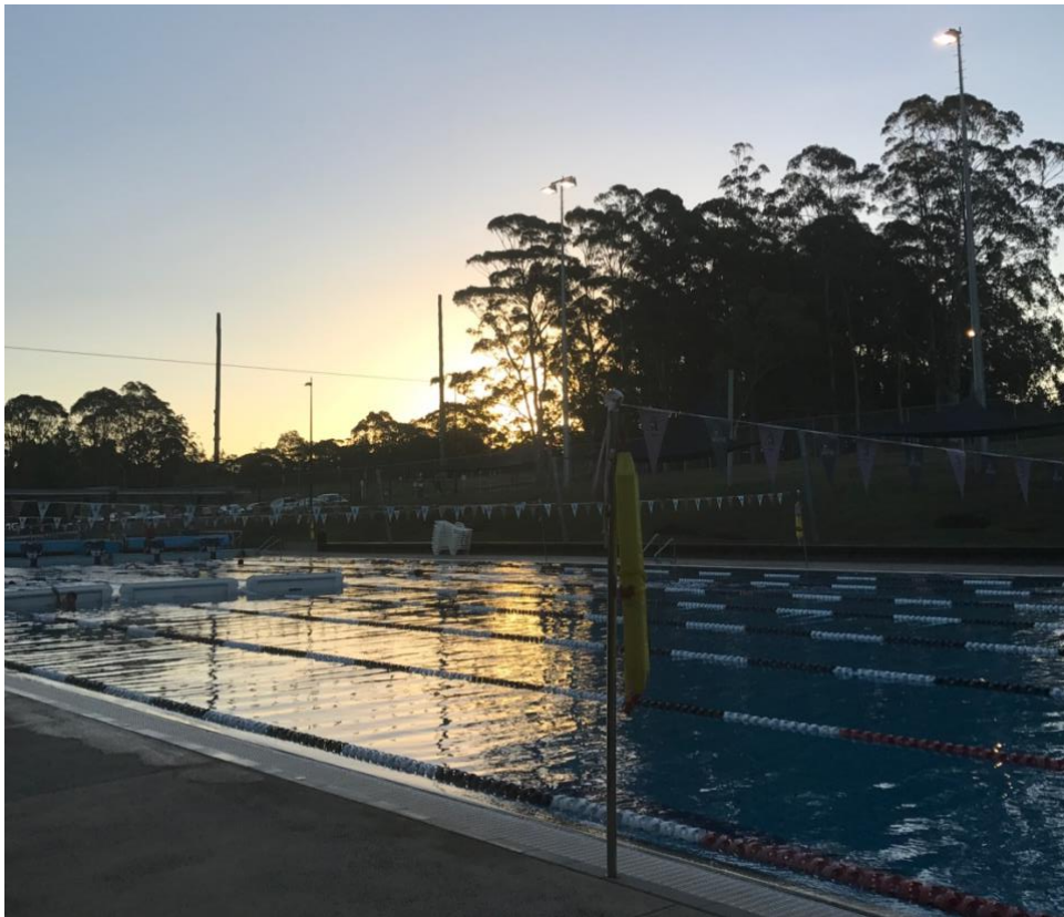
50m utomhuspoolen på Macquarie University Sport and Aquatic Centre, där jag också jobbade.